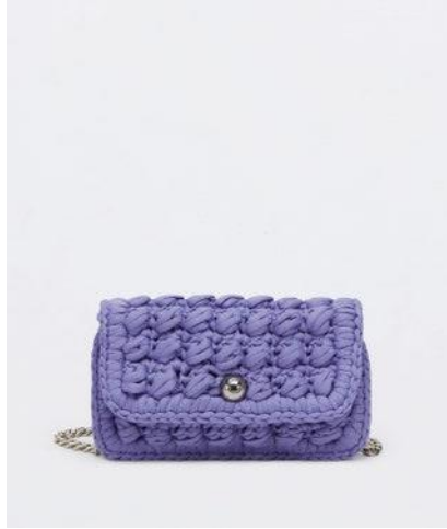
• Bottega Veneta 棉質鉤針銀鍊肩背包 NT$143,300