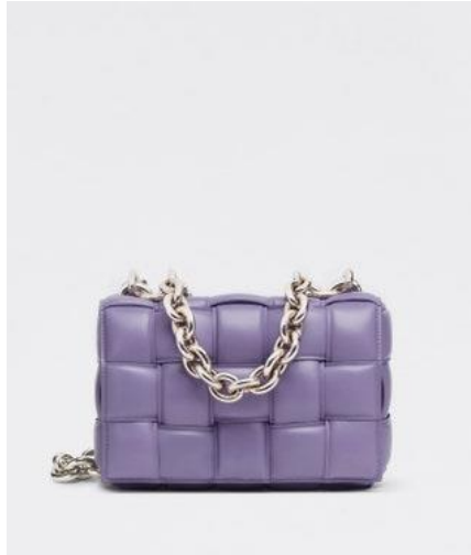
• Bottega Veneta 編織小羊皮金屬鍊肩背包 (花紫)